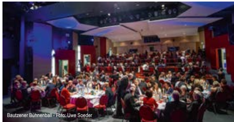
Bautzener Bühnenball - Foto: Uwe Soeder