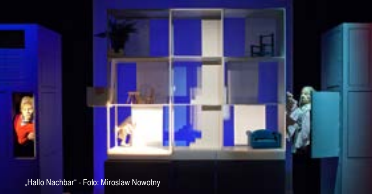
„Hallo Nachbar“