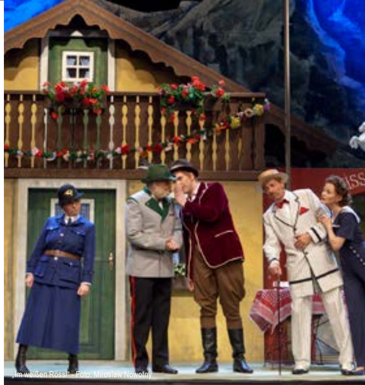
„Im weißen Rössl“

www.theater-bautzen.de • Telefon: (03591) 584 225