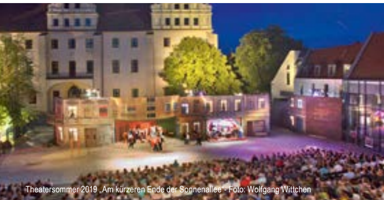
Theatersommer 2019 „Am kürzeren Ende der Sonnenallee“