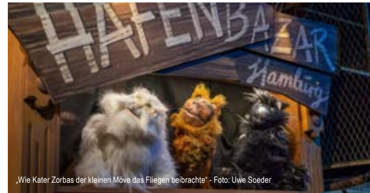
„Wie Kater Zorbas der kleinen Möve das Fliegen beibrachte“