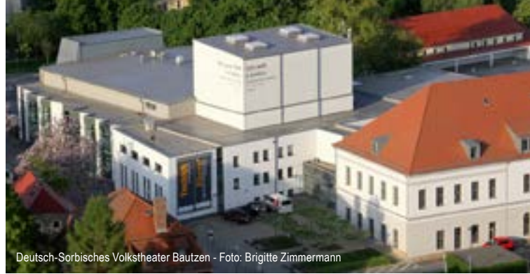
Deutsch-Sorbisches Volkstheater Bautzen

Der Startschuss für die Zusammenarbeit des BVMW-Bautzen mit dem Deutsch-Sorbischen Volkstheater Bautzen fiel bereits im Jahr 2000, als über die Zukunft des Theaters öffentlich diskutiert wurde. Dem Theater als „kulturellen Leuchtturm“ der Region sollte durch die Verbindung von Wirtschaft und Kultur mehr Strahlkraft verliehen werden. Der Bundesverband konnte durch seine guten Kontakte zu Unternehmern dabei behilflich sein. Eine 2006 initiierte Sponsoring-Aktion für die Foyerausstattung des gerade renovierten Theaters übertraf alle Erwartungen. 60.000 Euro konnten akquiriert werden. Seit 2008 bereichert zudem die gesponserte Drehbühne zahlreiche Inszenierungen. Vielen ist das Bautzener Theater Herzenssache. Und so regelt seit 2006 eine Kooperationsvereinbarung dieses einzigartige Zusammenwirken.