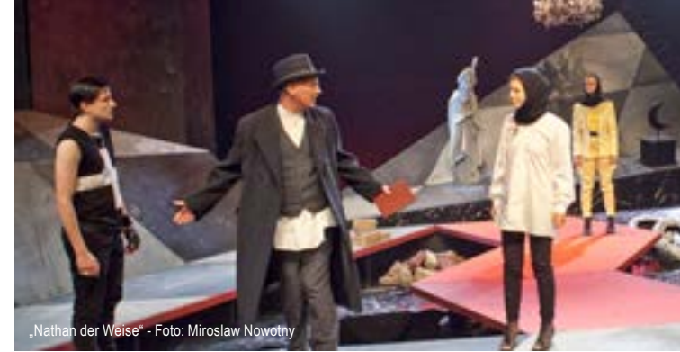
„Nathan der Weise“