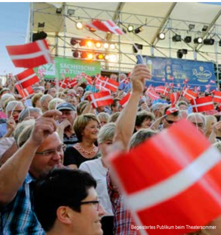
Begeistertes Publikum beim Theatersommer