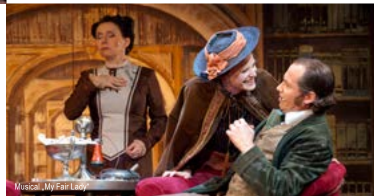
Musical „My Fair Lady“

www.theater-bautzen.de • Telefon: (03591) 584 225