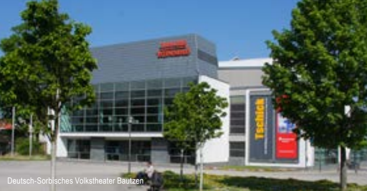
Deutsch-Sorbisches Volkstheater Bautzen

Eine 2006 initiierte Sponsoring-Aktion für die Foyerausstattung des gerade renovierten Theaters übertraf alle Erwartungen. 60.000 Euro konnten akquiriert werden. Seit 2008 bereichert zudem die gesponserte Drehbühne zahlreiche Inszenierungen. Vielen ist das Bautzener Theater Herzenssache. Und so regelt seit 2006 eine Kooperationsvereinbarung dieses einzigartige Zusammenwirken.