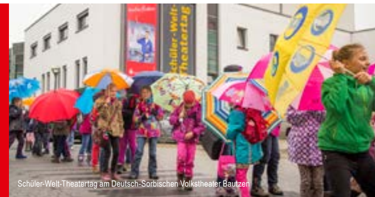
Schüler-Welt-Theatertag am Deutsch-Sorbischen Volkstheater Bautzen