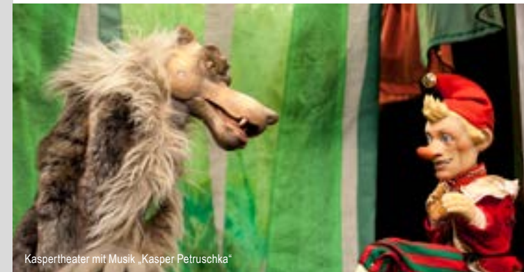
Kaspertheater mit Musik „Kasper Petruschka“