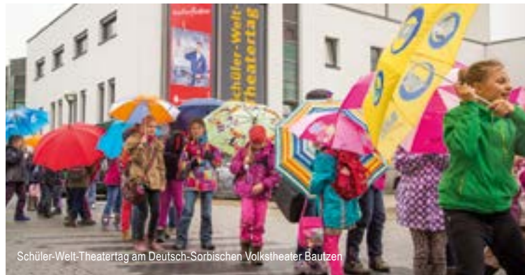
Schüler-Welt-Theatertag am Deutsch-Sorbischen Volkstheater Bautzen