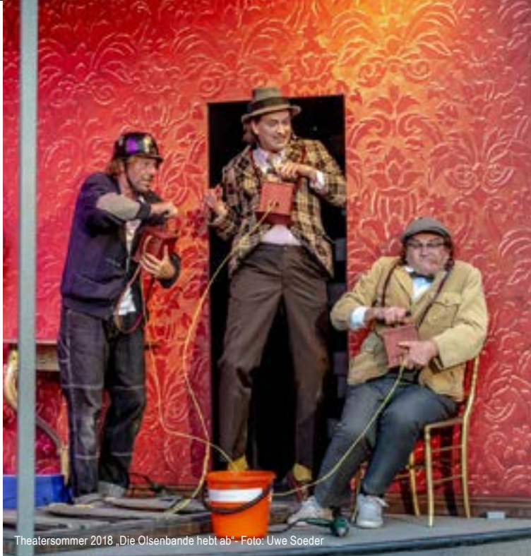
Theatersommer 2018 „Die Olsenbande hebt ab“

www.theater-bautzen.de • Telefon: (03591) 584 225