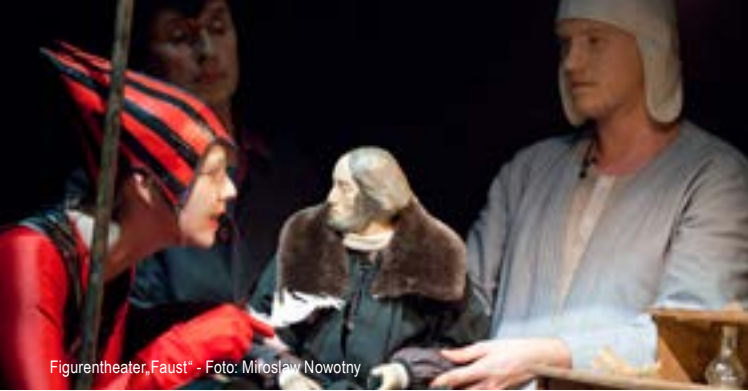
Figurentheater „Faust“