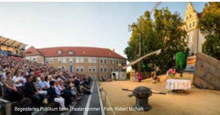
Begeistertes Publikum beim Theatersommer