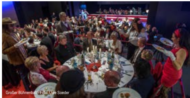
Großer Bühnenball