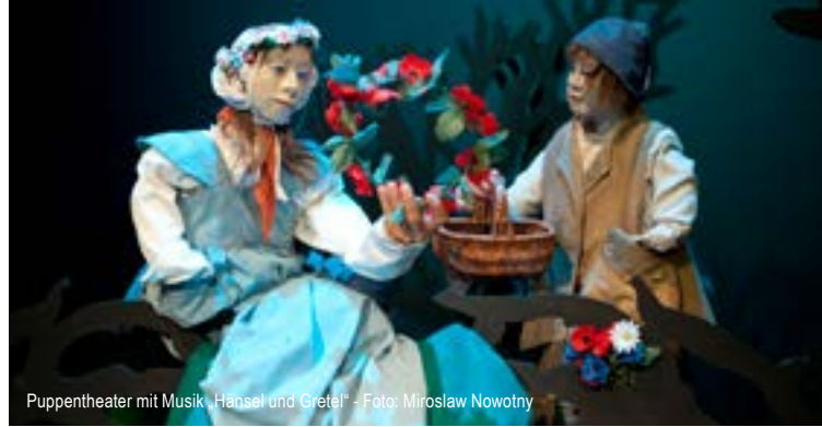
Puppentheater mit Musik „Hänsel und Gretel“