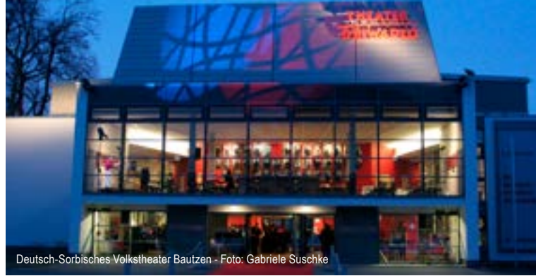
Deutsch-Sorbisches Volkstheater Bautzen

Der Startschuss für die Zusammenarbeit des BVMW-Oberlausitz mit dem Deutsch-Sorbischen Volkstheater Bautzen fiel bereits im Jahr 2000, als über die Zukunft des Theaters öffentlich diskutiert wurde. Dem Theater als „kulturellen Leuchtturm“ der Region sollte durch die Verbindung von Wirtschaft und Kultur mehr Strahlkraft verliehen werden. Der Bundesverband konnte durch seine guten Kontakte zu Unternehmern dabei behilflich sein. Eine 2006 initiierte Sponsoring-Aktion für die Foyerausstattung des gerade renovierten Theaters übertraf alle Erwartungen. 60.000 Euro konnten akquiriert werden. Seit 2008 bereichert zudem die gesponserte Drehbühne zahlreiche Inszenierungen. Vielen ist das Bautzener Theater Herzenssache. Und so regelt seit 2006 eine Kooperationsvereinbarung dieses einzigartige Zusammenwirken.